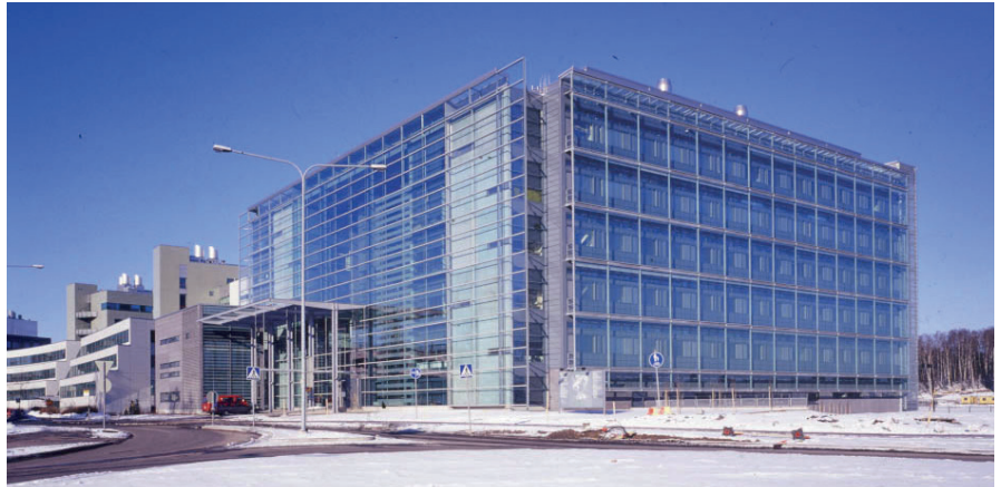
Helsingin yliopiston Biokeskus 3:n ikkunakalvoksi valittiin nano-teknologiaa hyödyntävä 3M Prestige -auringsuojakalvo, joka ei muuta rakennuksen ilmettä, mutta alentaa merkittävästi lämpökuormaa.

* Edellyttää, että 3M-ikkunakalvojen kiinnityksen suorittaa valtuutettu asennusliike, jolloin 3M-takuu on voimassa.